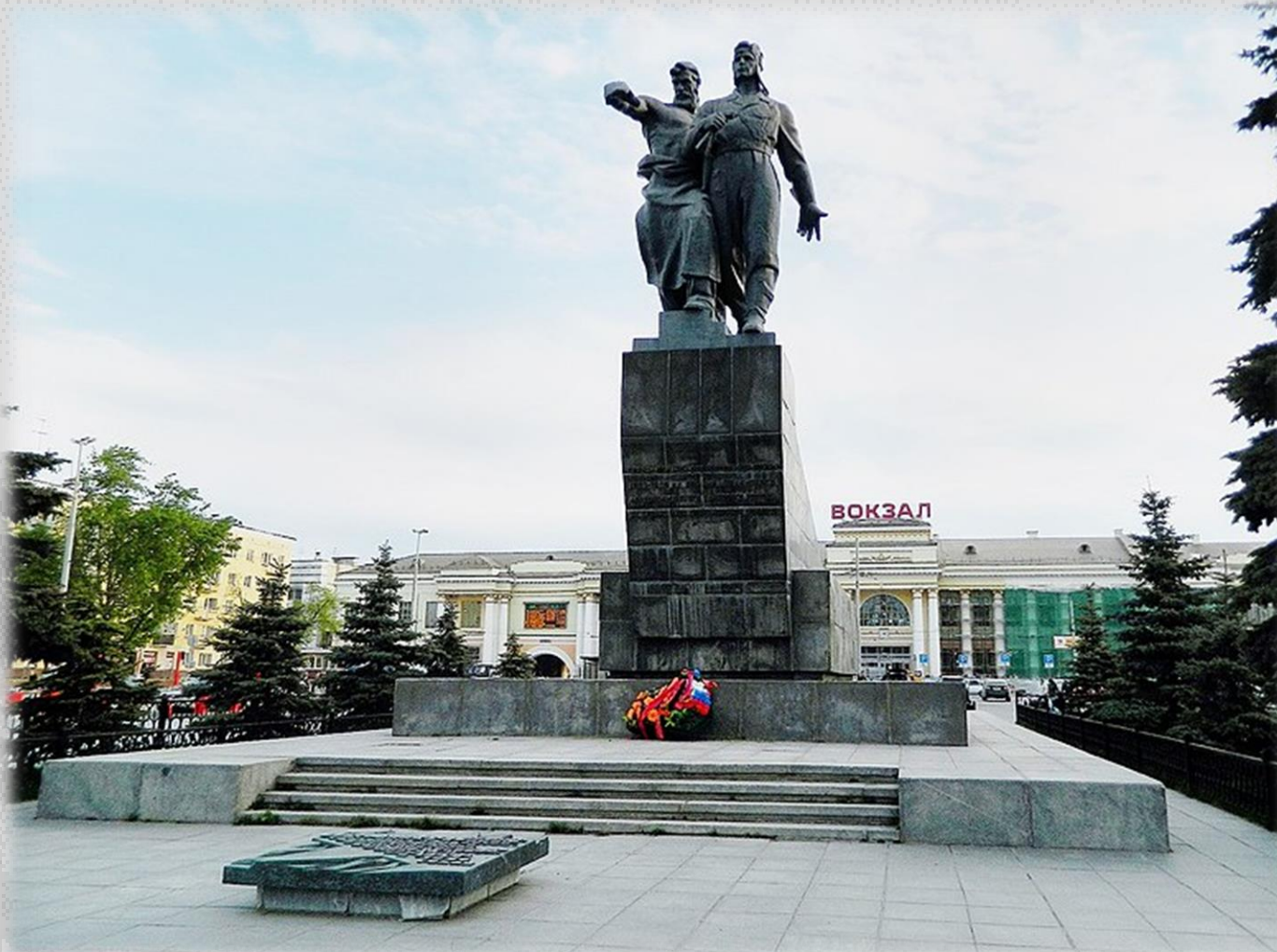
Памятник Уральскому добровольческому танковому корпусу на Привокзальной площади (совместно со скульпторами Петром Сажиным и Владимиром Друзиным)