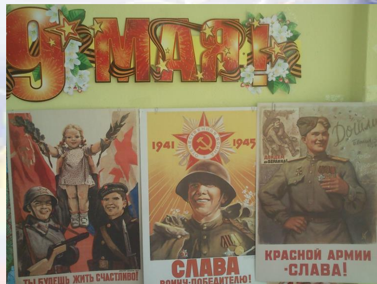
Плакаты 9 мая