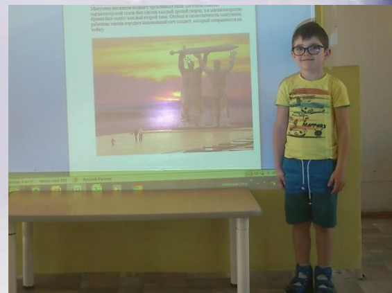
«Тыл – фронту»