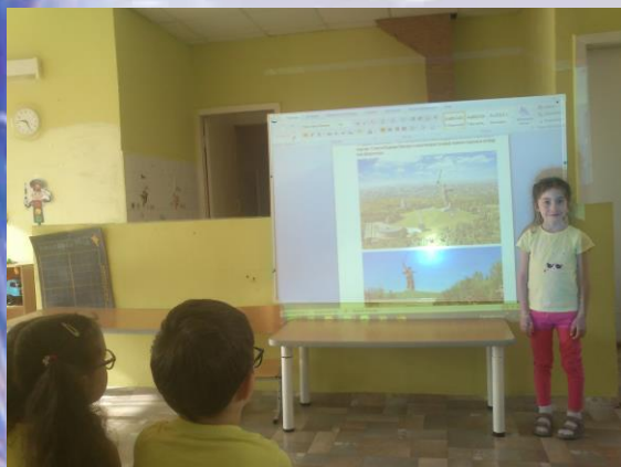
«Родина – мать зовет» Мамаев курган