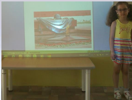
«Могила неизвестного солдата»